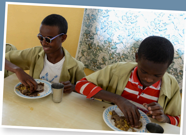
Titelbild: Das Erlernen der Blindenschrift ist der erste Schritt und eröffnet den Kindern den Zugang zu weiterer Bildung. Bild links: Die Schwestern legen Wert auf die ausreichende Ernährung der Kinder im angeschlossenen Internat.

Damit die Schwestern die laufenden Kosten für den Schul- und Internatsbetrieb decken können,